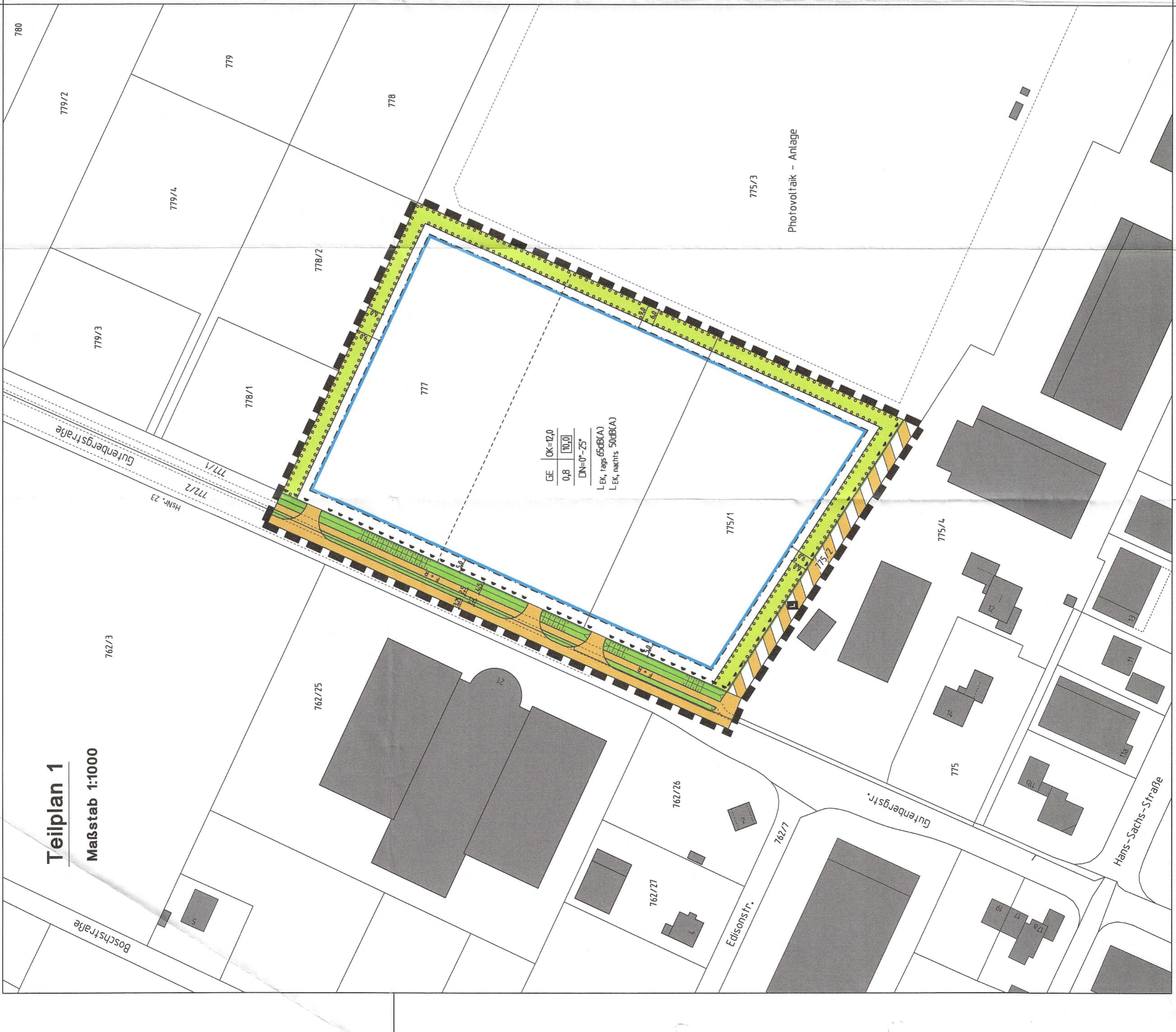
Teilplan 1 Maßstab 1:1000